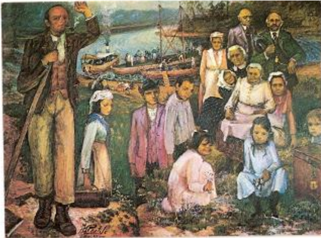
El arribo de los primeros colonizadores según un cuadro de Alfredo Pértile