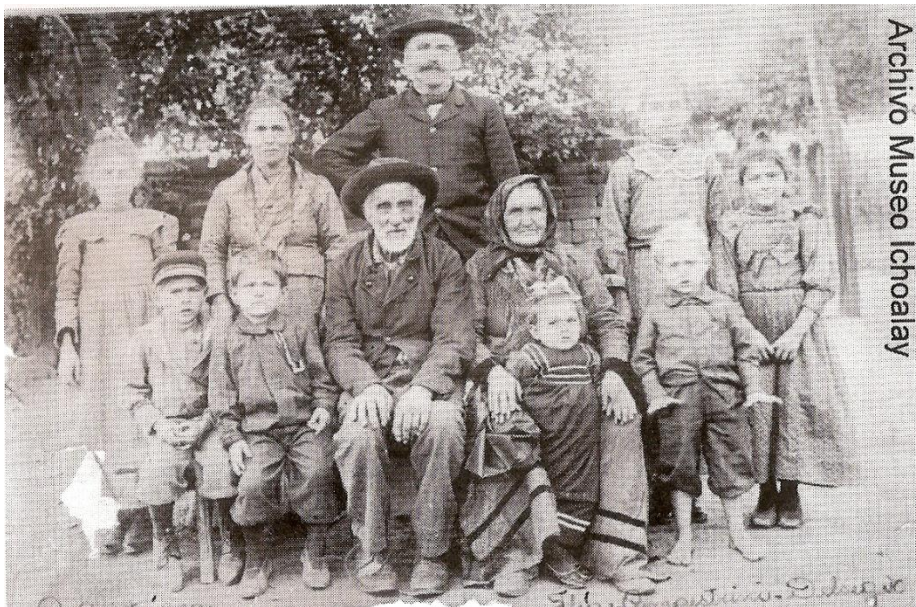
Típica familia de inmigrantes llegados a la Colonia Resistencia a partir de 1878.